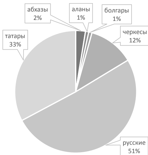
Рис. 2. Этнический состав рабов в Венеции (1434/43)

основании генуэзских источников, до 1350 г. в Генуе русские рабы составляли 1/5 часть всех рабов понтийского происхождения. После этой даты их число заметно падает, не превышая 5% и их место замещают татары. Нестабильность в Орде после смерти хана Джанибека (1357 г.) первоначально резко увеличивает долю и количество татарских рабов. В 50–80-х гг. XIV в. они составляют 91% черноморских рабов, а в 1381–1408 гг. — ок. 80%, тогда как доля русских рабов составляет 6%, при достаточно стабильной доле третьего важного этноса — черкесов — от 12 до 20% в среднем в течение всего периода 26 . В Генуе, по подсчетам Д. Джоффри, доля русских рабов в 1400–1424 гг. составляет 20%, в 1425–1449 гг. — 41,6%, в 1450–1474 гг. — 33,2%. Аналогичные показатели для татар: 41,5%–19,1%–15,5%, для черкесов: 29%–18,6%–37,1%. 27