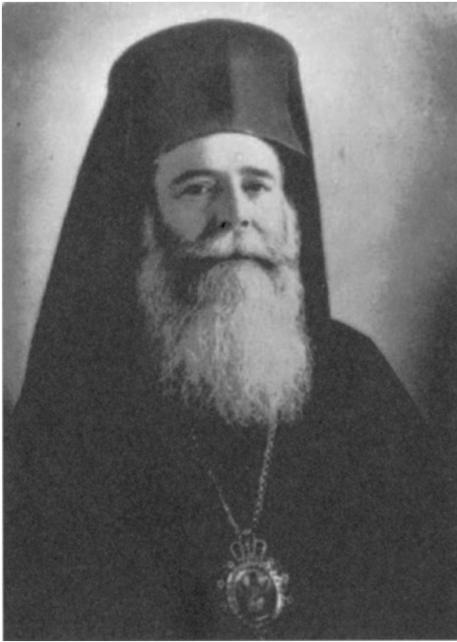
Рис. 1. Митрополит Трапезунда Хрисанф

го происхождения, таких как архимандрит Анфим Пападопулос, Д. Икономидис, Х. Миридис, Ф. Пастиадис, Х. Каландидис, Л. Иасонидис, А. Полихронидис, С. Николаидис, К. Кансыз, Л. Ламбриниадис и Л. Теодоридис 5 .