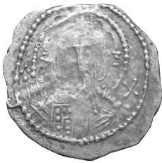
Монета № 3