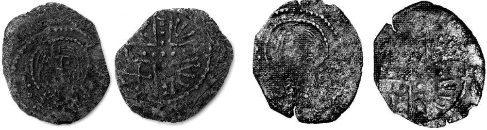
Монета № 1