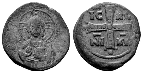
Рис. 2. Монета № 8 — анонимный фоллис класса С, время Михаила IV