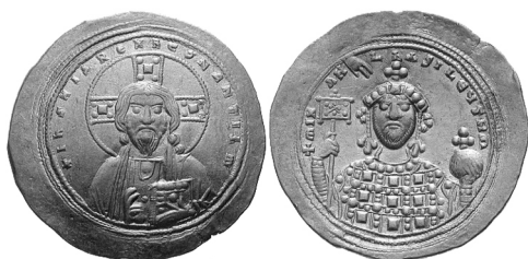
Рис. 3. Монета № 9 — гистаменон номисма, Михаил IV