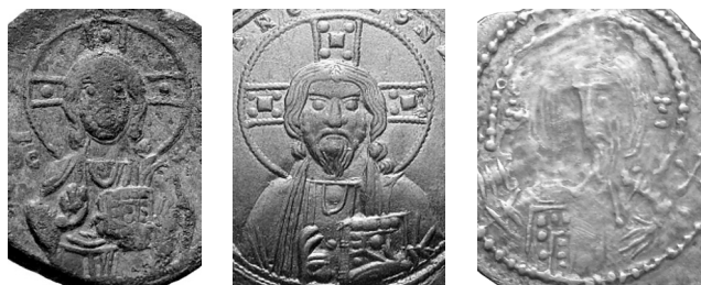
Рис. 4. Сравнение изображения Христа на монетах № 8, 9 и 3 (надпись на монете № 3 выполнена верно, изображение — зеркально)

Кюрике II, царь Ташир-Дзорагета (1048–1100), de facto азгапет — первый среди армянских Багратидов 43 и первый среди правителей, исповедовавших армянское христианство. От его имени в промежутке между 1048 и 1064/5 гг. были отчеканены медные монеты с оплечным изображением Христа. «Имперскость» образа Христа среди прочих изображений подтверждается и печатями, на которых он присутствует исключительно на хрисовулах византийских императоров.